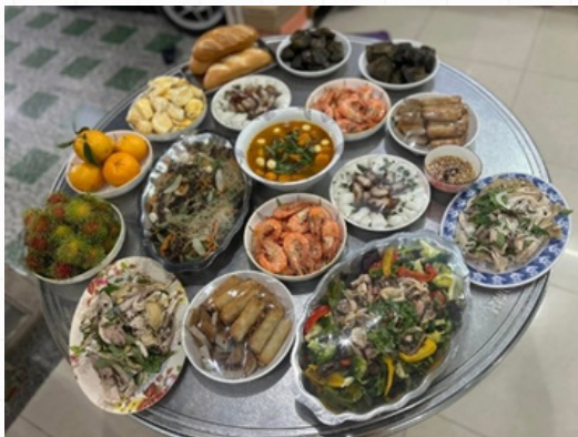
お母さんの手料理

家族が集まる祝祭日や正月が印象に残っています。家族と一緒に過ごす時間は、とても温かくて幸せなものでした。ベトナム料理がとてもおいしく、特に、母の手料理や、みんなで囲む食卓の料理は、どれも本当に美味しく、懐かしい味が心に残っています。ベトナムに帰省するときにはいつも「食べたい料理リスト」を作って、母に作ってもらうのを楽しみにしています。