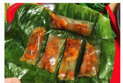
揚げバインボットロック タピオカ粉の揚げ餃子