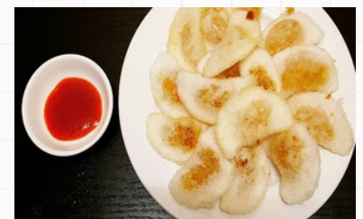
揚げバインボットロック タピオカ粉の揚げ餃子