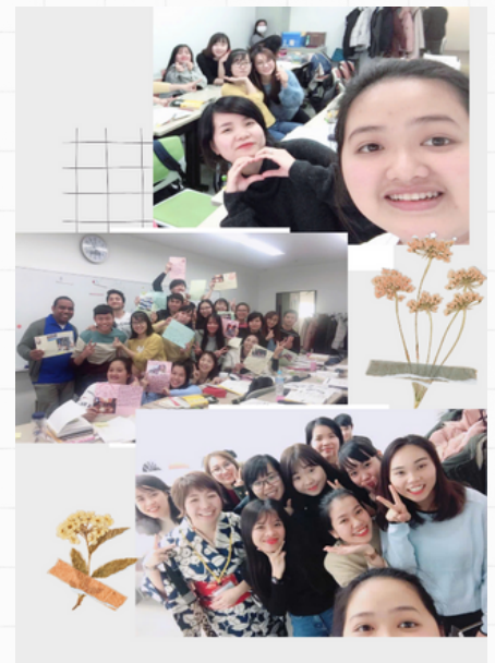
日本語を学んでいた クラスメイトと一緒に

日本で就職するために、2019年から浜松未来総合専門学校（旧：浜松情報専門学校）ビジネスライセンス課に通い、日本語で授業を受けていましたが、難しい専門用語などは調べながら学びました。2022年12月に日本語能力試験N1を取得しましたが、来日8年目の現在でも仕事の専門用語を含め、幅広い分野の日本語を勉強しています。